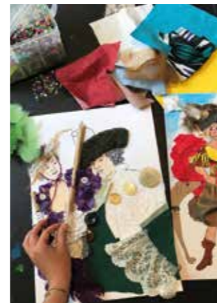
Atelier Crée ta propre maquette tactile , © Villa Vauban – Musée d'Art de la Ville de Luxembourg