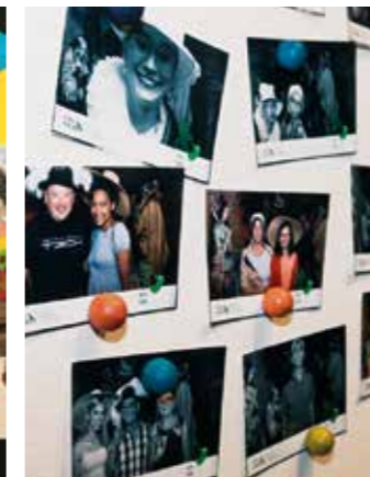
Salle de déguisement avec photomaton, © Villa Vauban – Musée d'Art de la Ville de Luxembourg