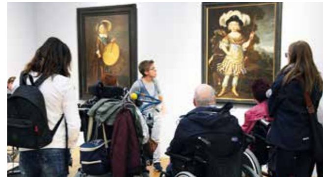
Visite guidée pour personnes à besoins spécifiques