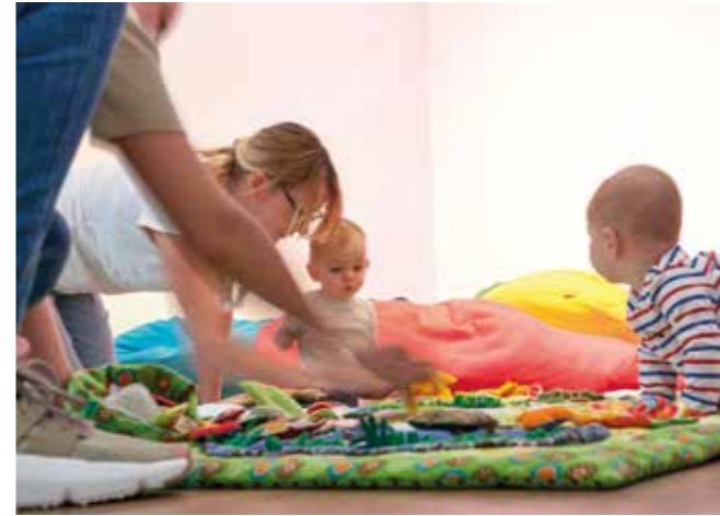
Tapis d'éveil