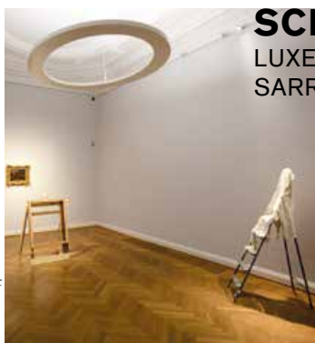
© Cécilia Céli, photo: Olivier Minaire

Depuis 1991, le Prix d'Art Robert Schuman offre une vitrine à la création artistique contemporaine de l'espace transfrontalier QuattroPole. Tous les deux ans et à tour de rôle, Luxembourg, Sarrebruck, Trèves et Metz organisent le Prix sous forme d'une exposition collective de 16 artistes en provenance de la Grande Région, parmi lesquel(le)s un jury détermine le ou la lauréat(e). Pour la 14 e édition de 2019, l'organisateur est la Ville de Luxembourg, avec comme lieux d'exposition le Cercle Cité et la Villa Vauban – Musée d'Art.