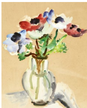
1. Wil Lofy (1937–2021), Série de figures abstraites 8 , Pastel sur papier 2. Joseph Kutter (1894–1941), Nature morte, anémones dans un vase , 1 er moitié du 20 e siècle, Gouache sur papier

L'exposition Bienvenue à la Villa ! (3). Art luxembourgeois du 20 e siècle offre la possibilité de découvrir l'art de la période allant du modernisme classique au début du millénaire. Dans le cadre d'une visite guidée, des termes tels que « art figuratif » ou « art abstrait » seront expliqués aux élèves de manière ludique, tout en découvrant des œuvres d'artistes luxembourgeois-es.