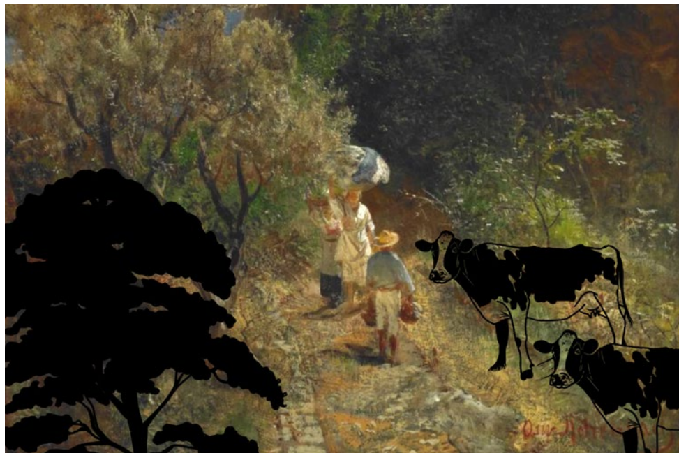
Oswald Achenbach (1827–1905), Vico Equense , c. 1870–1883, Huile sur toile © Les 2 Musées de la Ville de Luxembourg, réinterprétation par Jessica Frascht