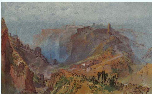
Joseph Mallord William Turner, The Rham Plateau and the Bock, Luxembourg, from the North-East , c. 1839, gouache, pen and ink and watercolour on paper